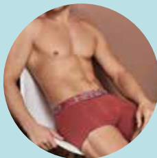
Ropa interior masculina