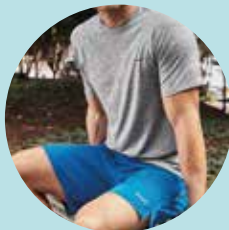
Ropa deportiva masculina