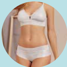
Ropa interior femenina